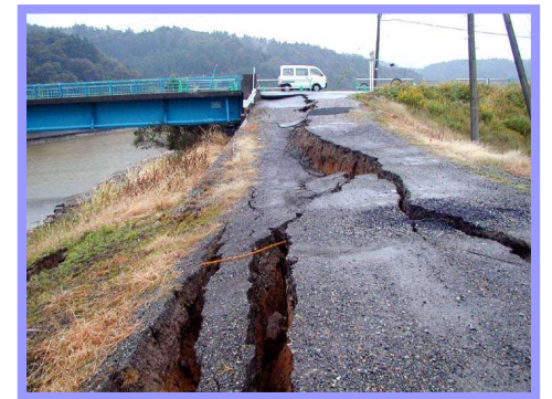
地団研専報54号 「新潟県中越地震の被害と地盤」より